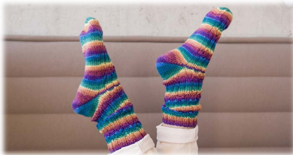
Socktober 2023, Socken Variante B aus Lana Grossa Meilenweit 6-fach in Farbe 9588

Die zweite Socke gleich stricken. Bei Sockengarnen mit einem speziellen Farbeffekt dabei im gleichen Farbrapport beginnen und ggf. etwas Material abwickeln.